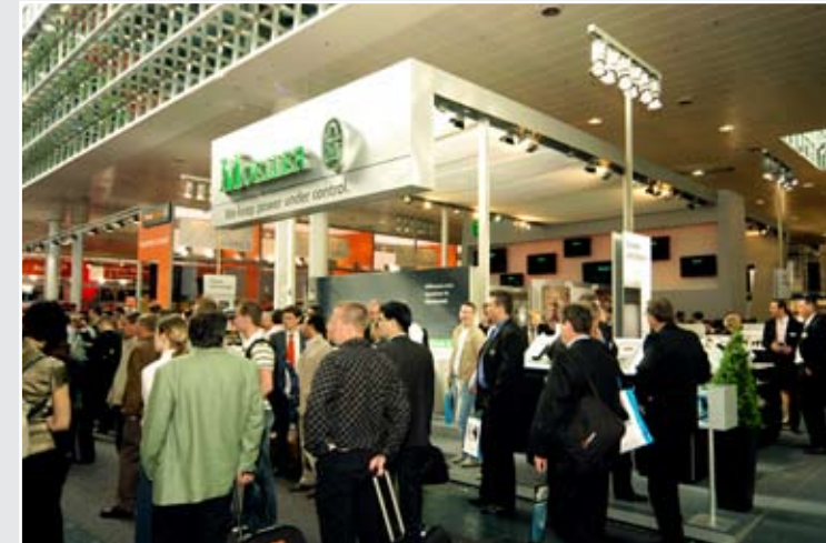
Moeller-Firmenstand auf der Hannover Messe Industrie 2007

Obwohl erst kurze Zeit im Einsatz, hat die neue PIM-Plattform die Moeller-Anwender bereits überzeugt: Derzeit arbeiten rund 30 Produkt- und Stammdaten-Mana-