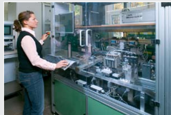
Justageautomat zur Qualitätskontrolle von Leitungsschutzschaltern

über „nächtliche“ automatische Schnittstellen in die PIM-Plattform übertragen. Da hier auch die komplette Verwaltung der Klassifizie-